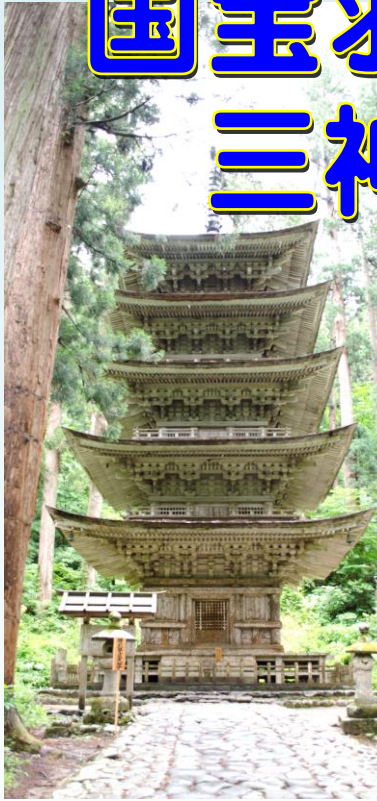
■国宝五重塔 (イメージ)